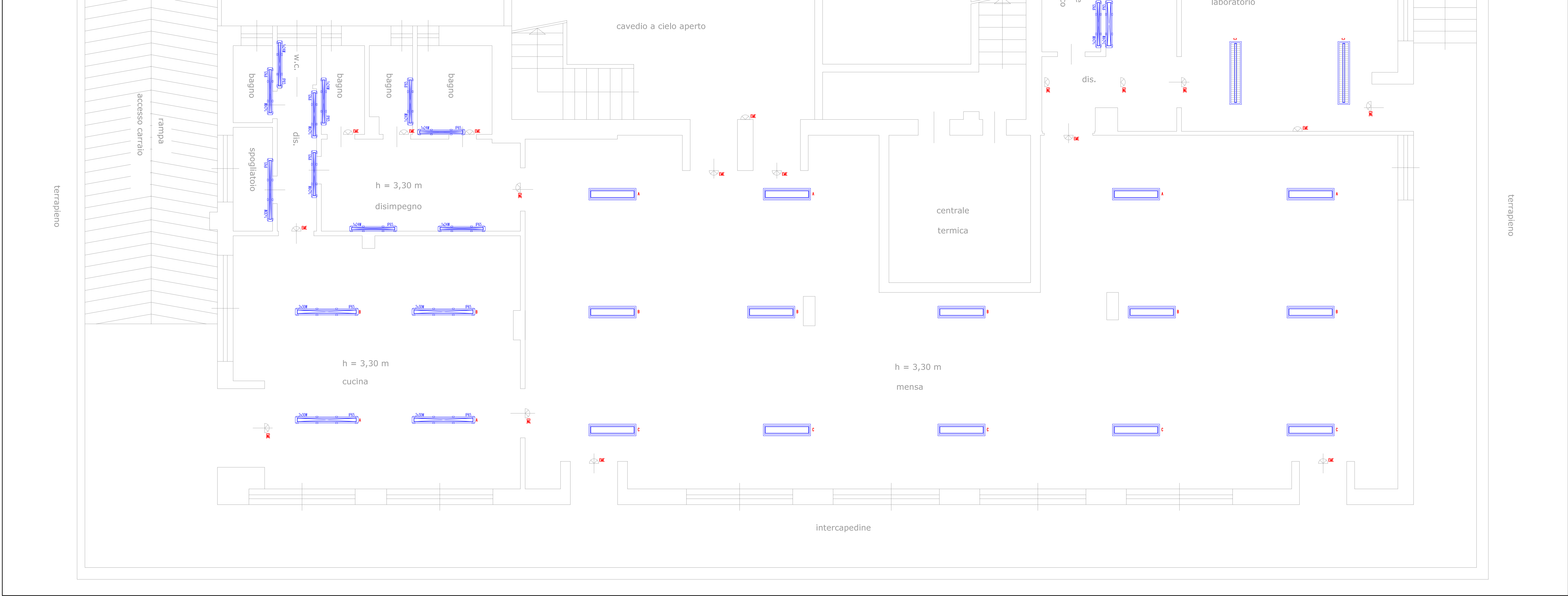
Planimetria impianto di illuminazione - Progetto - Scala 1:50